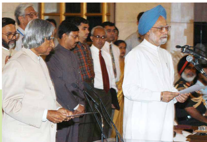
Manmohan Singh takes oath as Prime Minister at the Rashtrapati Bhavan on May 22, 2004.

in an era of increased economic growth and the emergence of an aspirational Indian populace. He fundamentally altered the nation's economic trajectory, elevating millions from poverty and establishing India's presence on the global economic stage. These policies ultimately contributed to India's ascension as one of the world's fastest-growing major economies. His landmark economic reforms and strong imprint on the Indian economy lasted long.